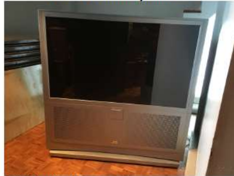
Prix de base 50$ avant taxes

Il est possible de visiter ces équipements sur rendez-vous. Veuillez prendre note que ceux-ci sont vendus tels quels sans aucun recours contre la municipalité.