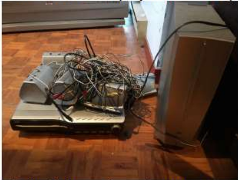
Prix de base de 75$ avant taxes