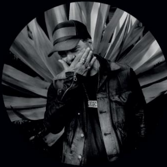
DANIEL LANOIS 3 NOVEMBRE