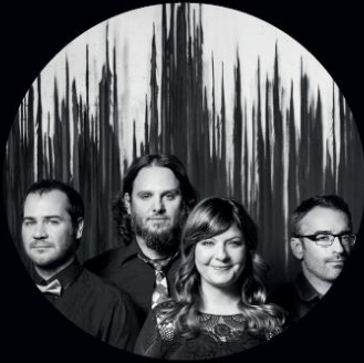
LES COWBOYS FRINGANTS 13 OCTOBRE