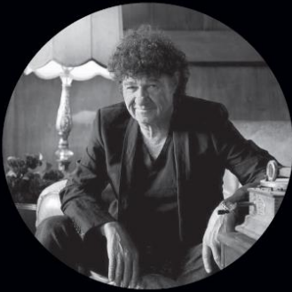
ROBERT CHARLEBOIS 17 NOVEMBRE