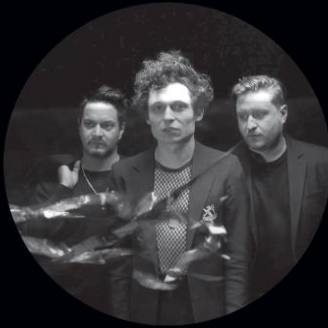
WE ARE WOLVES 22 SEPTEMBRE