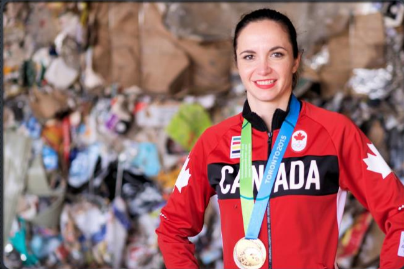
AUDREY LACROIX, ATHLÈTE OLYMPIQUE ET PORTE-PAROLE