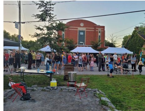
Une foule de citoyens à participé à l'épluchette de blé d'inde et au spectacle amateur présenté par La Municipalité et la microbrasserie Les Grands Bois. Ce fut une magnifique soirée pendant laquelle les citoyens ont aussi pu profiter des Vendredis Sains !