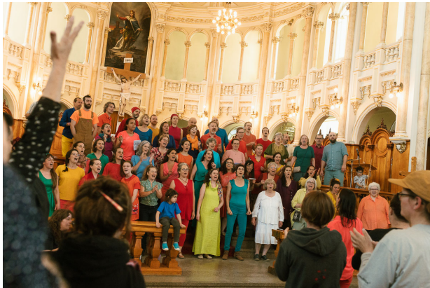
La chorale Harmonies sud-Africaines s'est produite dans l'église et nous a offert une performance hors du commun. L'entrée à ce magnifique spectacle était gratuite pour les citoyens !