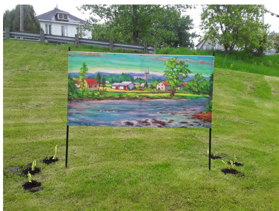
Des fresques magnifiques faites par des artistes locaux ont été dispersées aux quatre coins du village pour le plaisir de nos yeux.