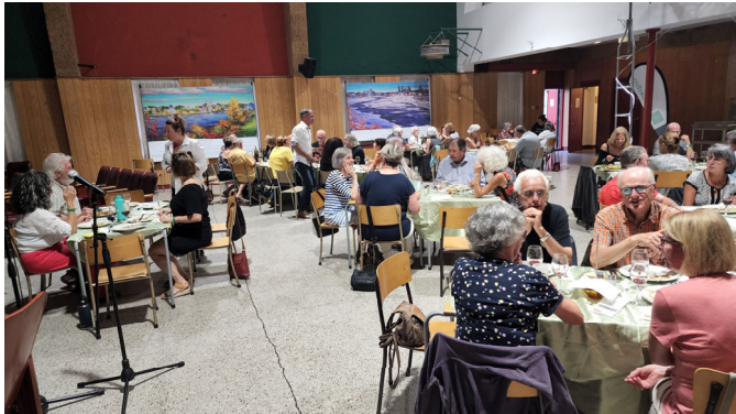
Le festival de film de Portneuf sur l'environnement nous en a mis plein les yeux et plein le cœur en cette année en plus d'offrir un Kabaret Kino St-Kasimir.