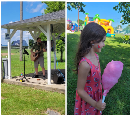
Une St-Jean Baptiste bonifiée avec 6 jeux gonflables, un chansonnier, de la barbe à papa et plein de surprises, à donné un coup d'envoie spectaculaire à ces fêtes du 175ieme ! Des gens heureux, des enfants avec des étoiles dans le yeux, c'est ça Saint-Casimir !