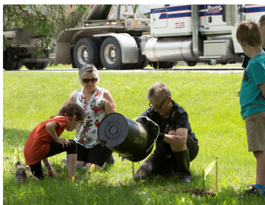
Des Tournesols géants ont été plantés partout dans le village avec la collaboration des enfants de l'école afin de souligner les fêtes du 175ieme.

Les fêtes du 175ieme de Saint-Casimir tirent à leur fin ! Nous souhaitons par la présente remercier tous les participants qui se sont impliqués de près ou de loin dans ce grand projet, vous en avez fait une réussite. De plus, la Municipalité souhaite offrir à ses citoyens un récapitulatif souvenir de ces fêtes qui furent un succès sur toute la ligne ! Merci à tous !