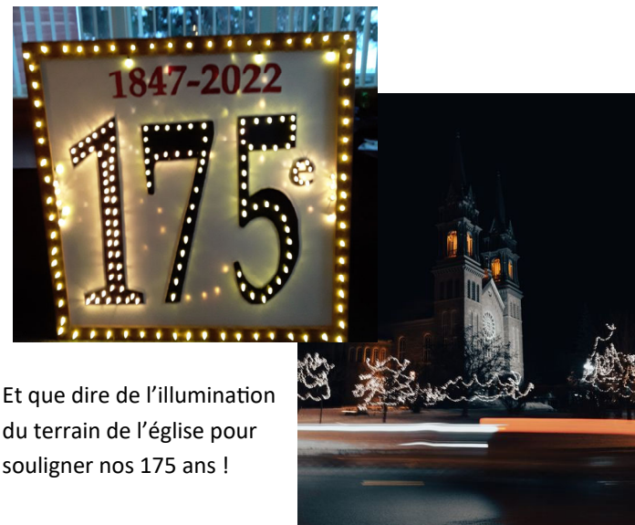
Et que dire de l'illumination du terrain de l'église pour souligner nos 175 ans !