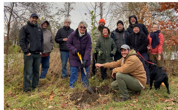
Plantation de 175 arbres pour 175 ans ! Une magnifique idée ! Un autre lègue pour les futures générations.