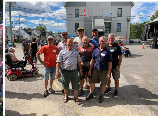
Un pique-nique retrouvailles a rassemblé des résidents, certains anciens et certains nouveaux, dans une fête pleine de bonne humeur ! Certaines personnes ne s'étaient pas vu depuis plusieurs années et c'était une occasion parfaite pour renouer ! Une activité qui restera gravée dans les cœurs des Casimiriens et Casimiriennes.