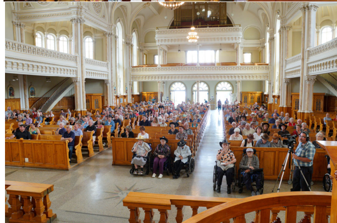
La messe country qui fut suivie du brunch du 175ième en a émerveillé plus d'un. Ce fut encore une belle occasion de se rassembler et de fêter dignement notre belle Municipalité.