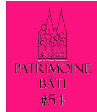
Et que dire du parcours historique identifiant les maisons faisant parti du patrimoine Bâti !

Vous pouvez écouter ce parcours sur: www.lesgrandsbois.com/sonsdici .