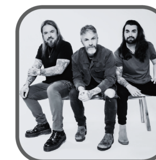
KAIN 23 NOVEMBRE