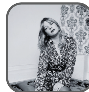
BASIA BULAT 27 OCTOBRE