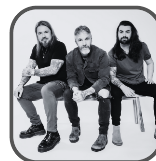
KAIN 23 NOVEMBRE