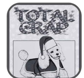
TOTAL CRAP 8 DÉCEMBRE