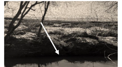
Figure 1: Exemple d'une ravine qui rend inefficace la bande riveraine pour filtrer les eaux de surface en provenance du champ

Cependant, la qualité de l'eau de la rivière Niagarette ne peut se prévaloir des mêmes éloges. En dépit des efforts déployés au début 2000, notamment de plantation de bandes riveraines, elle demeure la moins bonne des tributaires de la rivière Sainte-Anne. On en observe même une dégradation depuis quelques années, principalement en raison de l'augmentation des concentrations en phosphore. Cette dégradation pourrait notamment s'expliquer par l'incision des bandes riveraines, réduisant ainsi leur efficacité à filtrer les sédiments qui transportent du phosphore.