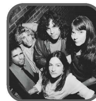
BON ENFANT 2 MAI