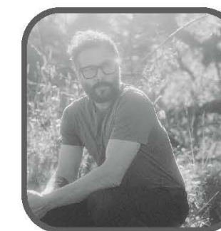
TIRE LE COYOTE 9 MAI